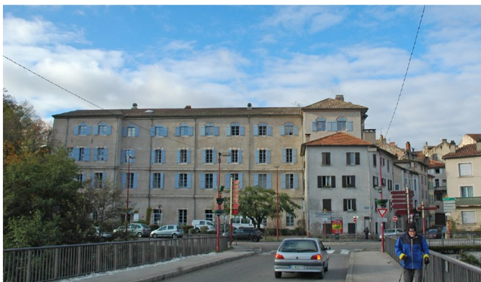
Le projet de déconstruction rue du pont neuf depuis le pont de Cabessut et l'entrée de ville

Situé dans la partie Nord du secteur sauvegardé, dans le périmètre de l'îlot du Château du Roi défini par la collectivité comme prioritaire, l'aménagement de la rue du Pont Neuf participe pleinement à l'opération de requalification du centre-ville.