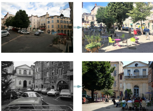
La place de la Libération...