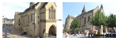
Les allées de Mortarieu à Montauban