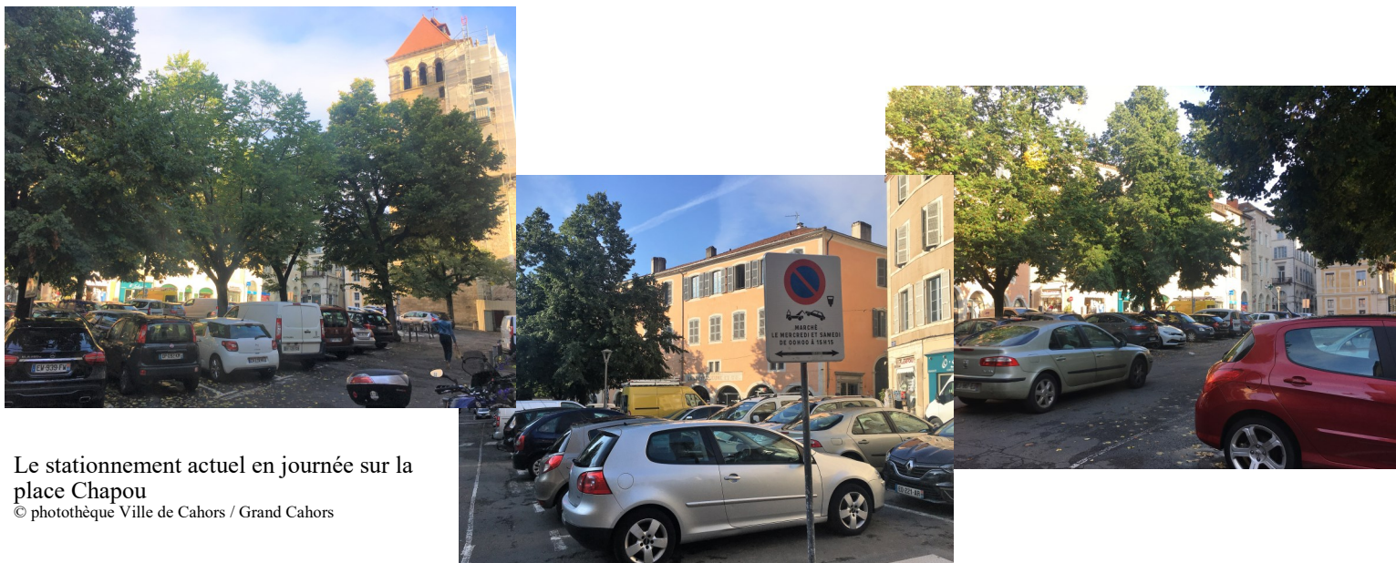
Le stationnement actuel en journée sur la place Chapou